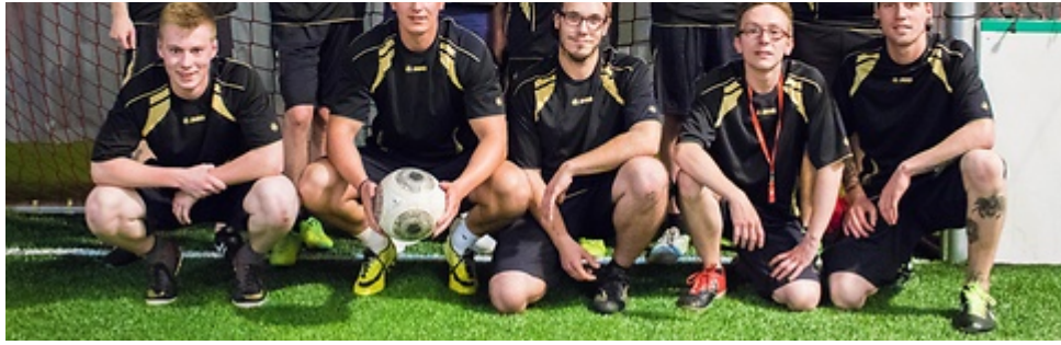
Auch äußerlich eine Freude: 11 Freunde des Kickens und der IG BCE von der Solvay GmbH

An der Vorrunde ab 10 Uhr morgens beteiligten sich außer den Paperboys folgende Teams: der SV Steuler aus der im Westerwald (Höhr-Grenzhausen) beheimateten Steuler-Gruppe; die Lahn-Kicker vom Papierhersteller Lahnpaper GmbH in Lahnstein; ebenfalls aus Lahnstein ein Team des Spezialchemie-Unternehmens Zschimmer & Schwarz; zwei Mannschaften des SV Solvay vom Werk Bad Hönningen, wo die Solvay GmbH Grundstoffe für Ziegel, für Bildschirmglas, für Elektromagneten und für Reinigungsprodukte herstellt; der SV Weig vom gleichnamigen Recycling, Verpackungs- und Kartonunternehmen in Mayen; und schließlich die Mannschaft aus Mitgliedern des gewerkschaftlichen Bezirksjugendausschusses (BJA), die unter dem schönen Label "Dynamo Mittelrhein" antrat.