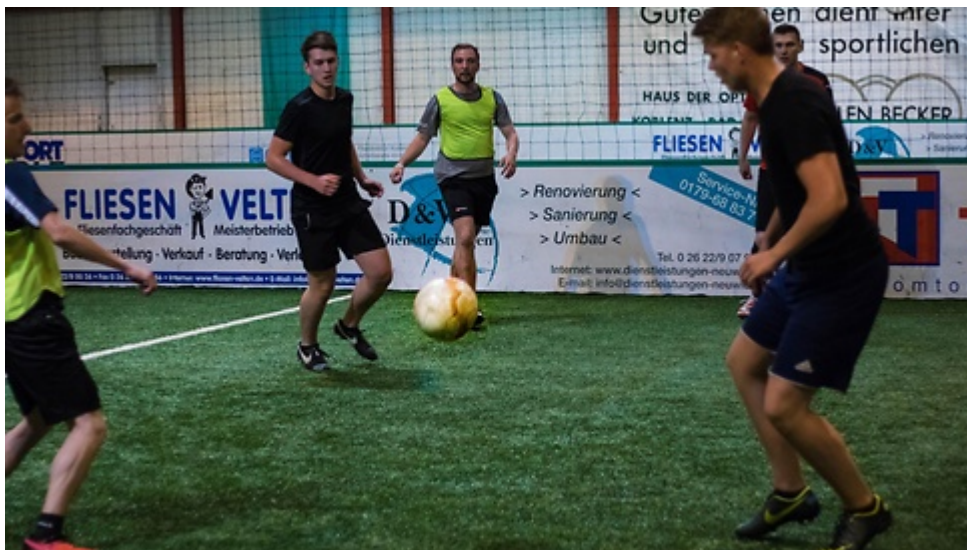
Der Eindruck täuscht: Es spielten auch junge Frauen mit